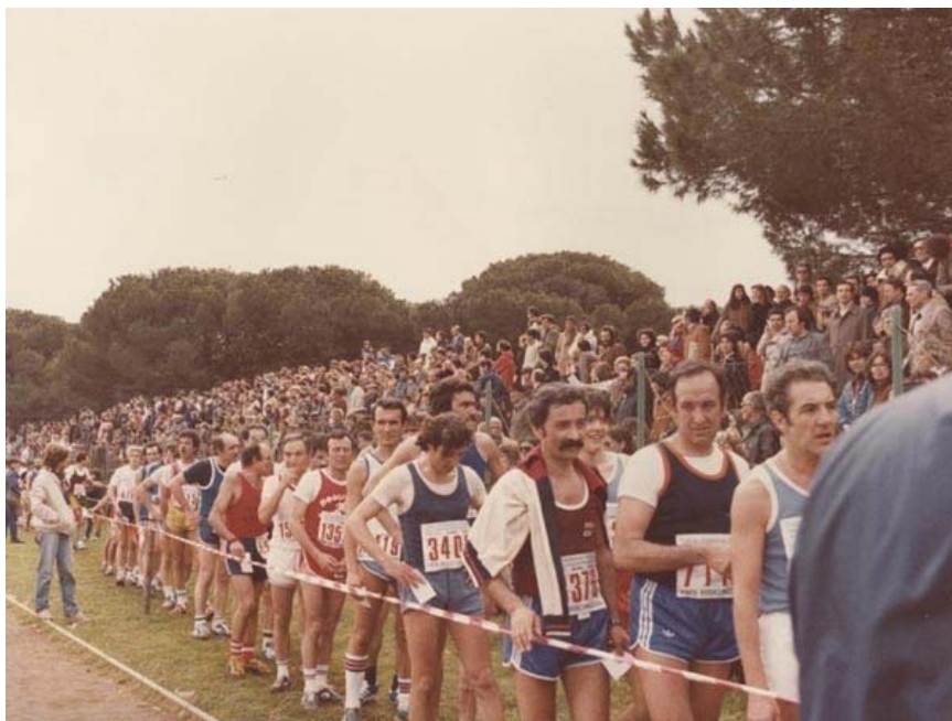
1981 - Arrivo Roma Ostia nello stadio della Stella Polare