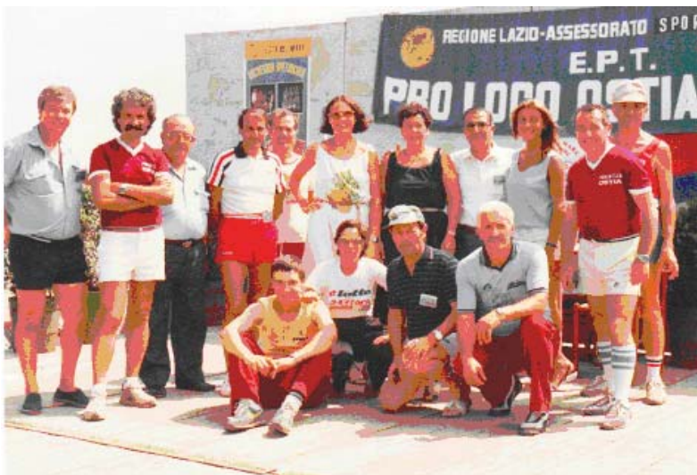
1981 - Gara organizzata dalla Podistica ostia all'Idroscalo