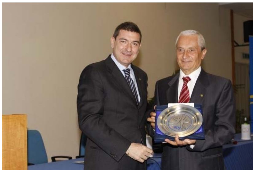
2009 - Riceve dal Presidente Nazionale AICS Bruno Molea il premio "Una vita per lo sport"