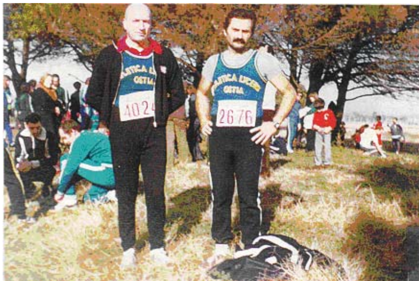
1977 – La Lyceum Ostia alle Belsitiadi