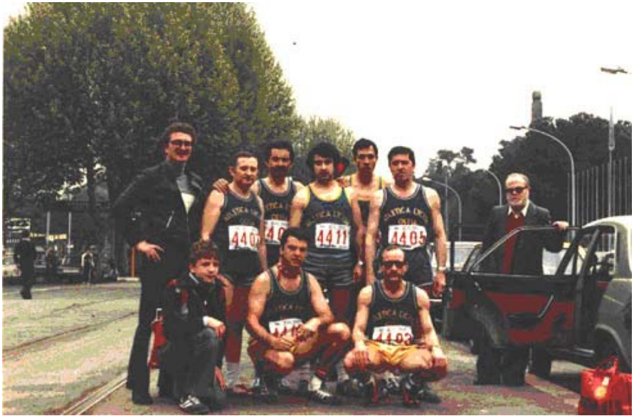
1977 – Partenza Roma-Ostia (28 km) con la Lyceum Ostia