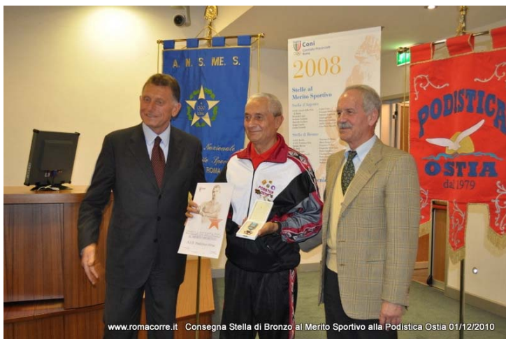
www.romacorre.it Consegna Stella di Bronzo al Merito Sportivo alla Podistica Ostia 01/12/2010