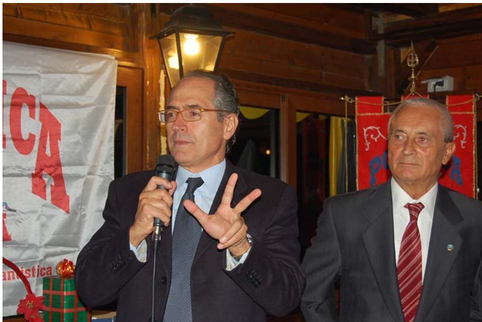
Con D. Masala (Olimpionico di Pentathlon) alla festa dei 30 anni della Podistica Ostia ( 2009)