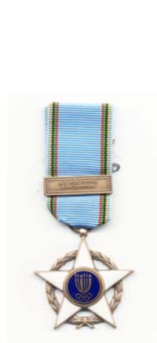
Gianni Gola (Presidente FIDAL Nazionale) all'assegnazione della Stella di Bronzo al Merito Sportivo 2010 - Stadio Olimpico (Sala Conferenze)