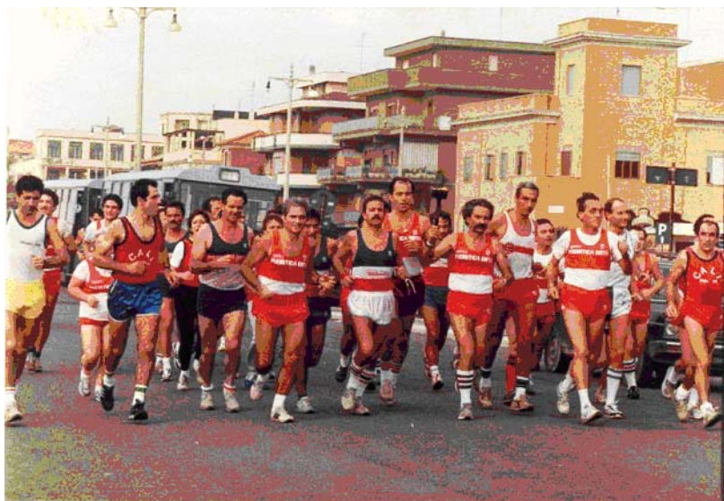
1984 Staffetta Roma Ostia (per Centenario di Ostia pontile)