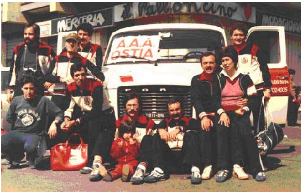
1978 – Arrivo Roma-Ostia con la AAA Ostia